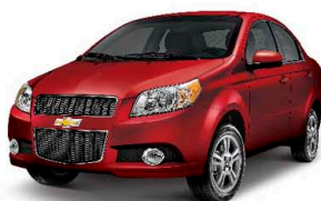
Đỏ cuốn hút (GCS)