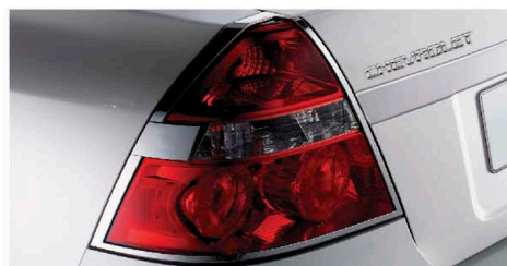
Ốp đèn hậu mạ crôm