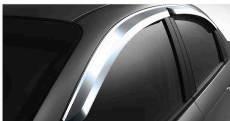
Ốp mí cửa (crôm)