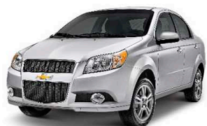
Bạc sang trọng (92U)