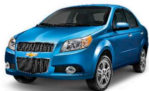
Xanh dương mạnh mẽ (GCT)