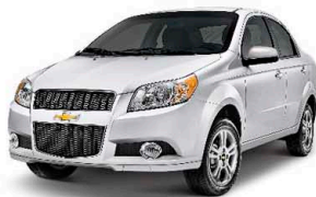
Trắng trang nhã (11U)