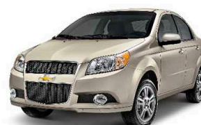
Vàng hoàng kim (GCZ)