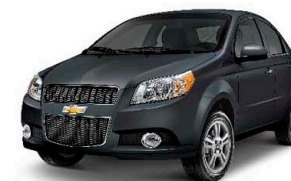
Ghi khòe khoắn (GCV)