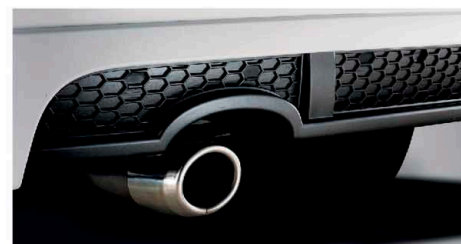
Chụp đuôi ống xả