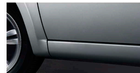
Ốp ba bờ lê quanh xe