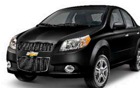
Đen đẳng cấp (87U)