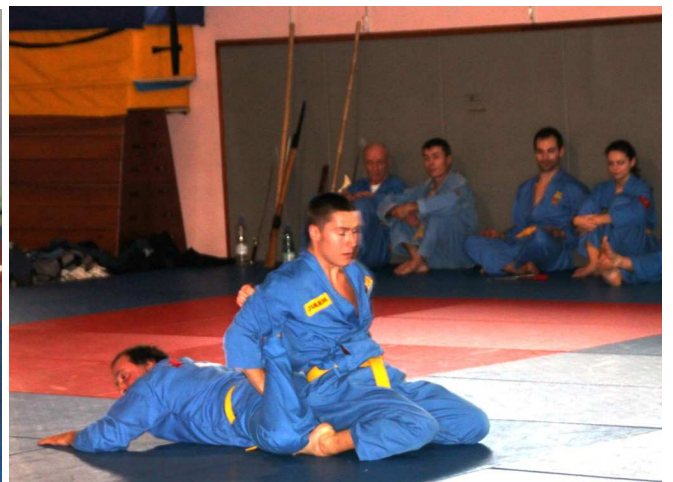
Song luyện ba