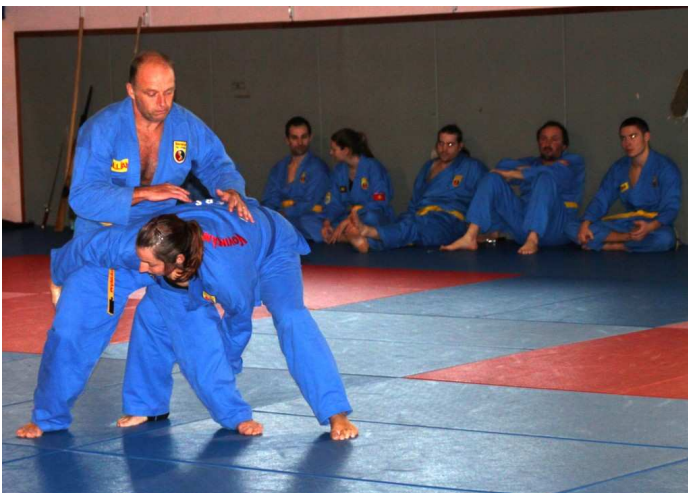
16 thể Phản đòn (16 contre-attaques du 2ème niveau )