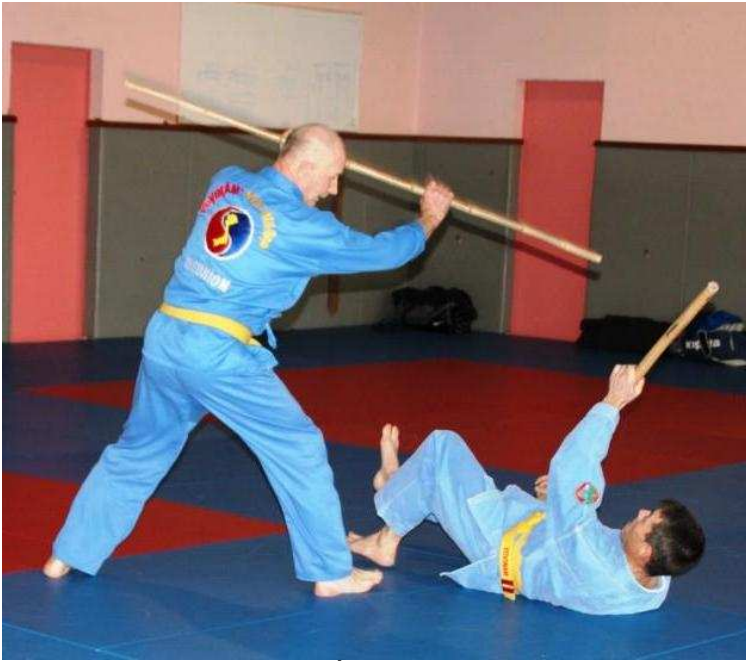
12 thể côn ( bâton )