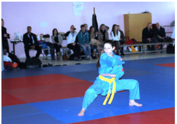
Ngũ môn quyền