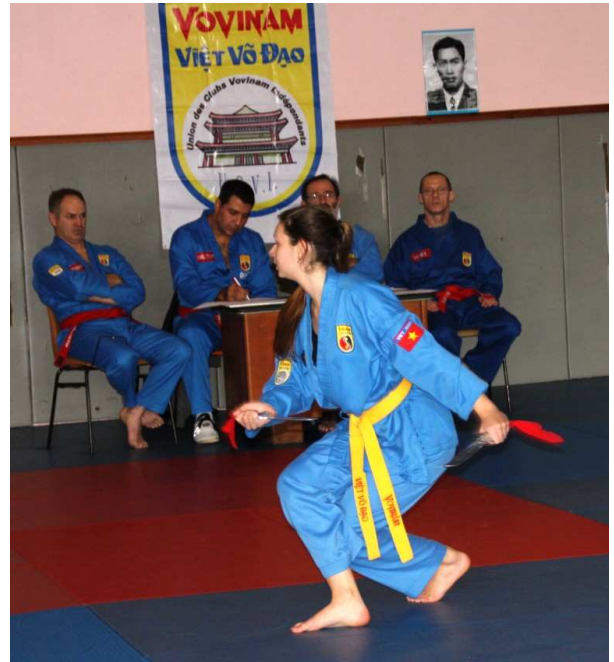
Song dao pháp ( Quyên du double couteau )