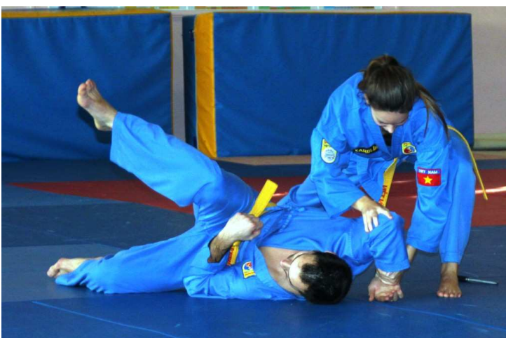
12 Phản đòn dao (12 contre-attaques couteau)