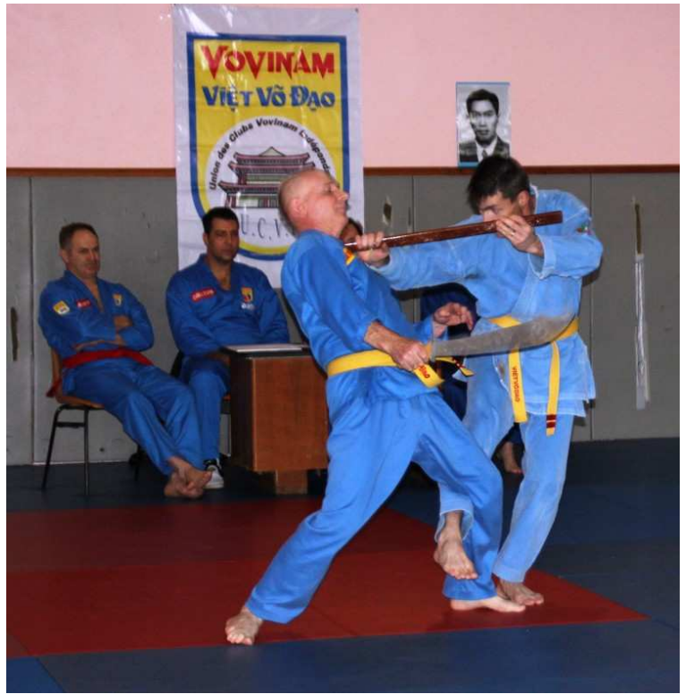
12 Phản đòn tay trước ( la règle )