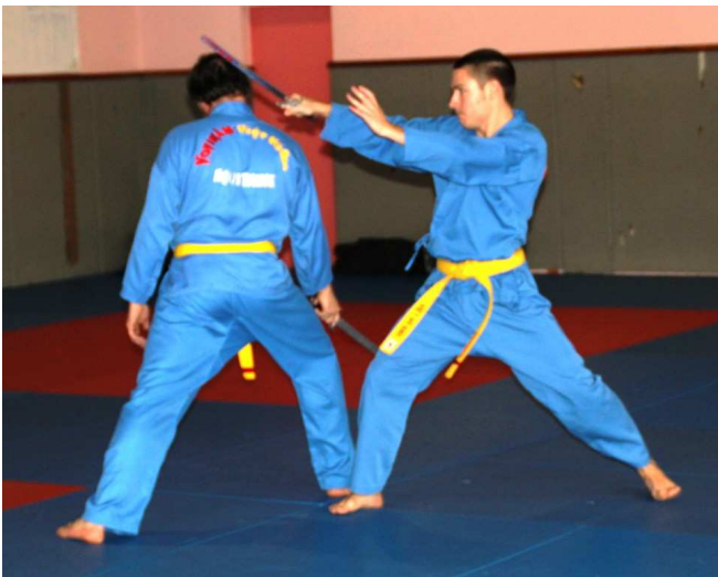
15 thế kiếm ( sabre )