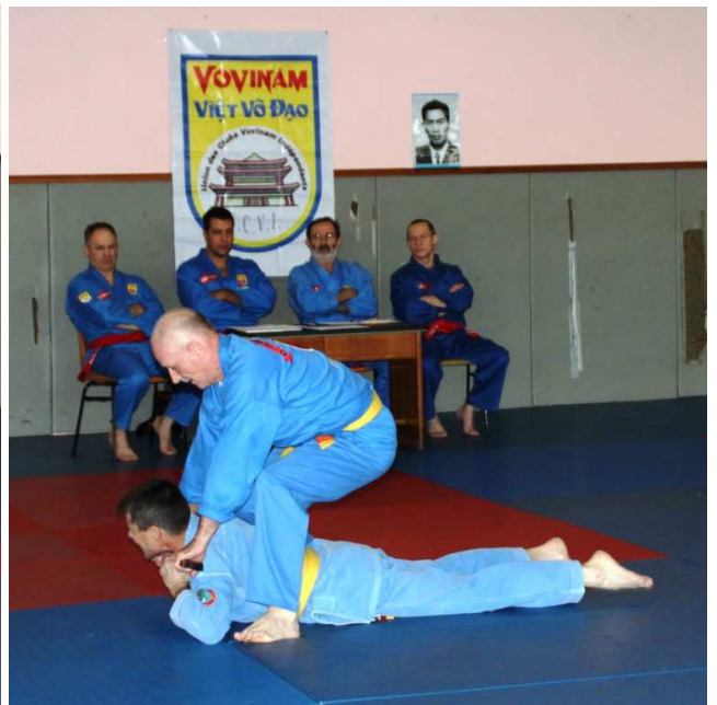
9 thể tay không đoạt súng trường (9 techniques de fusil avec baïonnette).

Ci-dessous 4 thể đoạt súng ngắn ( contre pistolet)