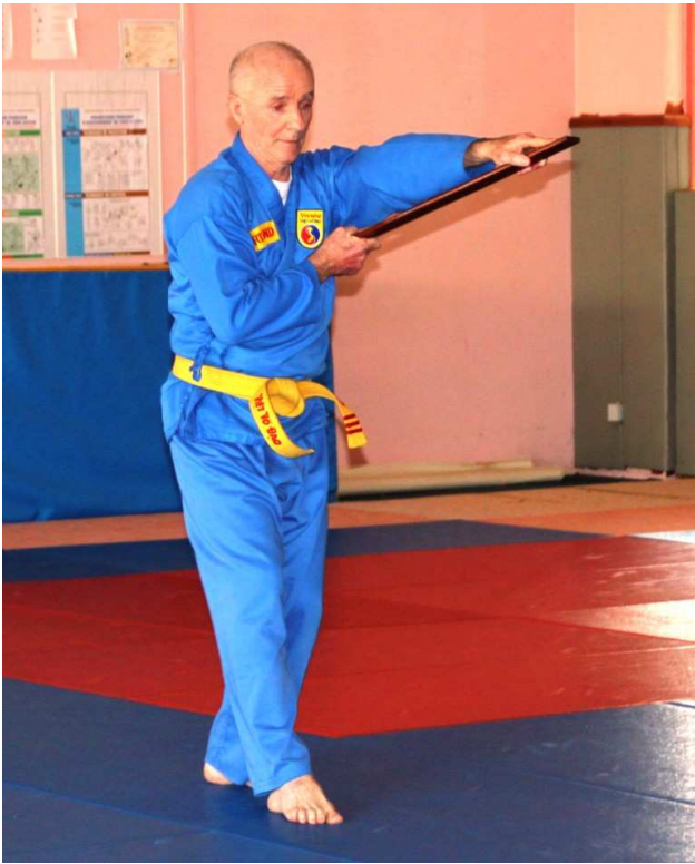
Mộc bản pháp ( tay trước ): Quyền de la règle.