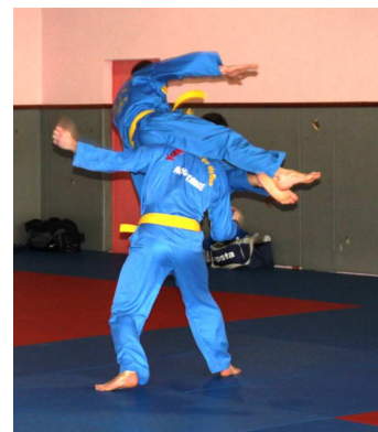
5 Đòn chân (ciseaux 10 à 14)