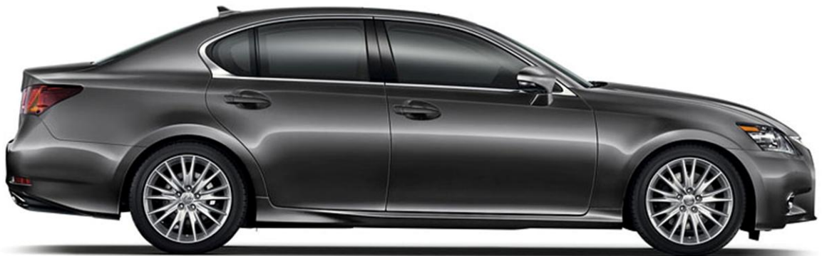
XÁM THỦY NGÂN