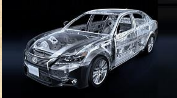
Cảm giác lái thoải mái vượt trội

Với hệ số giảm chấn khí động học và hệ số cản của xe bằng 0,26, bạn sẽ cảm nhận được độ bám đường hoàn hảo và trải nghiệm cảm giác lái tuyệt vời.