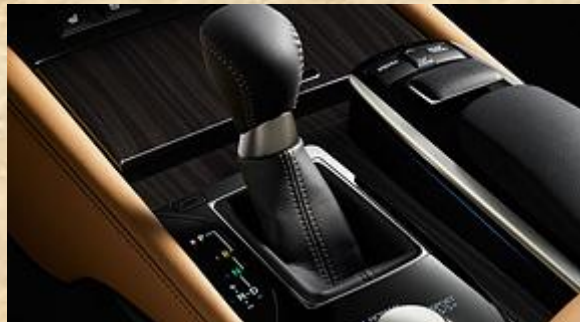
Hộp số 8 cấp

Với GS 350, bạn sẽ có được cảm giác lái đầy phần khích. Sự kết hợp giữa khung gầm chắc chắn hơn và hệ thống treo trước và sau áp dụng công nghệ mới mang đến cho bạn sự thoải mái và tự tin sau tay lái.