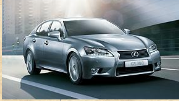
Hệ thống khí động học thông minh

Với hệ số giảm chấn khí động học và hệ số cản của xe bằng 0,26, bạn sẽ cảm nhận được độ bám đường hoàn hảo và trải nghiệm cảm giác lái tuyệt vời.