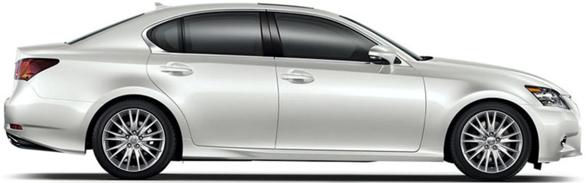
TRẮNG NGỌC TRAI